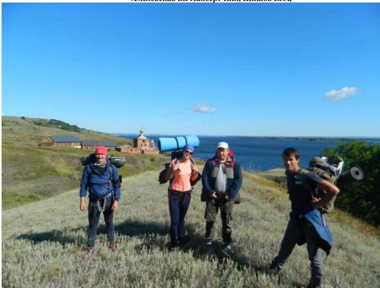
Фото 3. Группа вышла с ночевки (2 день)