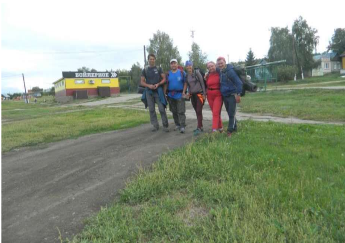
Фото 10. Группа на финише. Хвалы́нск (6 день)