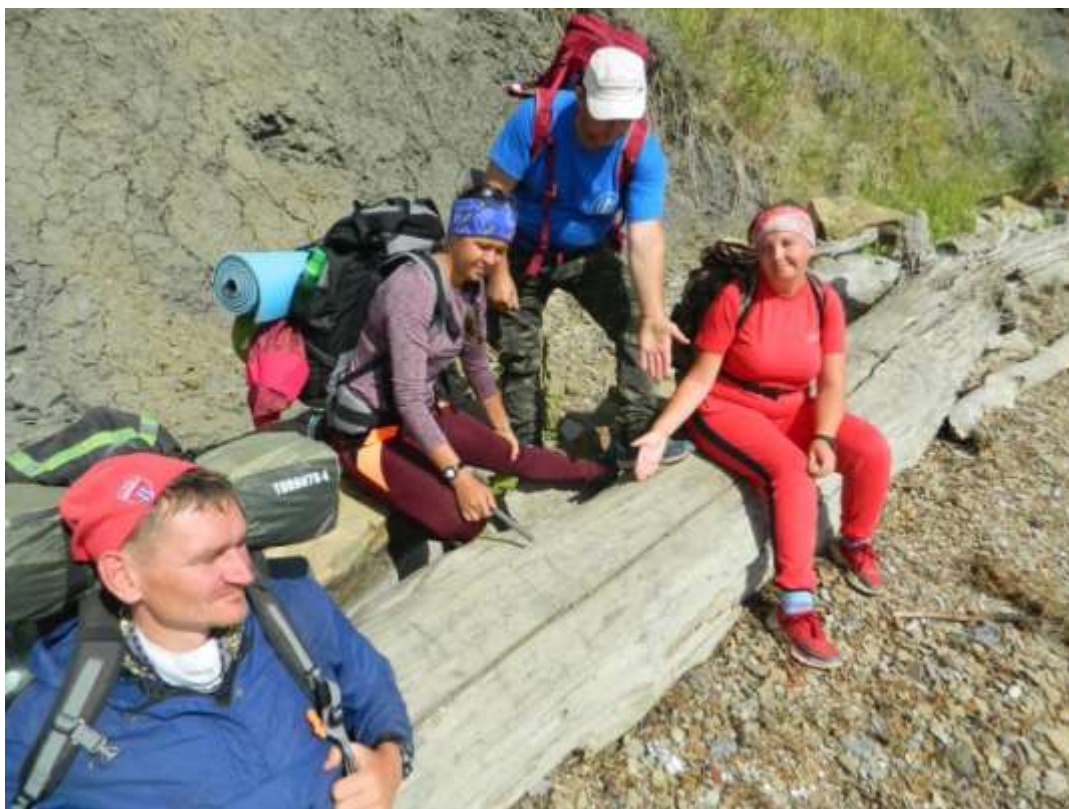
Фото 6. Оставляем