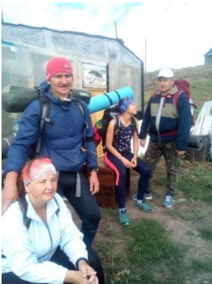
Фото 4. Группа проходит Вязовку (3 день)